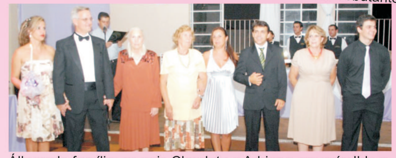
Princesas e Príncipes de honra cortejaram a bela debutante