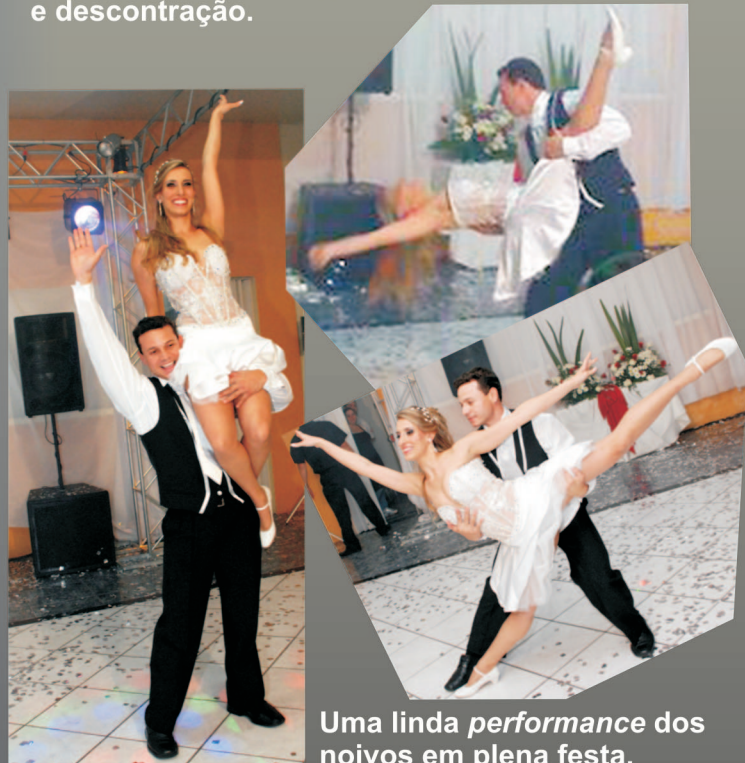
Uma linda performance dos noivos em plena festa.